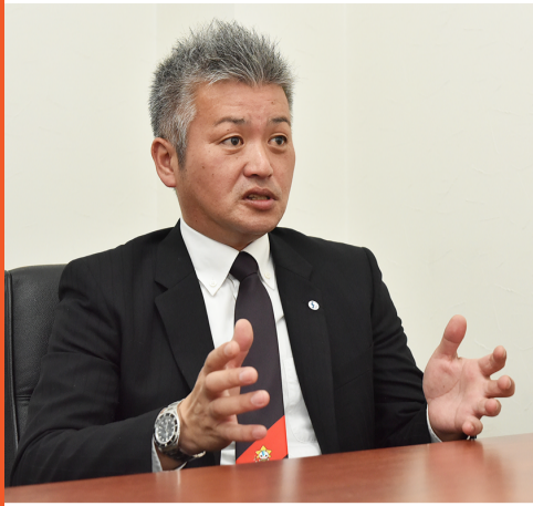
平成28年度会長 茂原商工会議所青年部