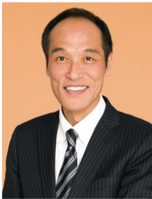
元宮崎県知事、元衆議院議員 東国原 英夫氏